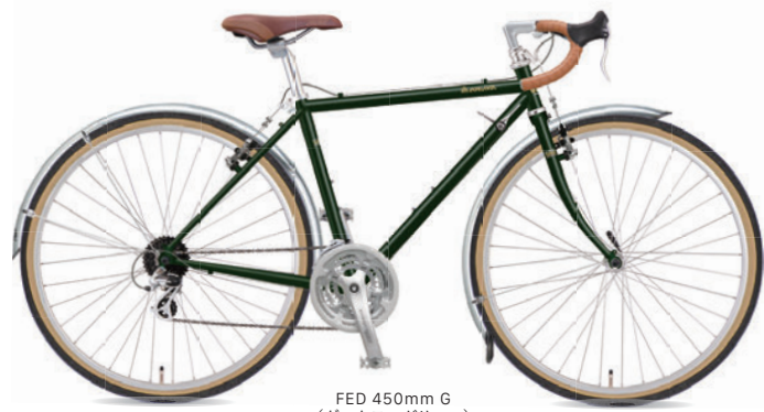
FED 450mm G (ダークモスグリーン)