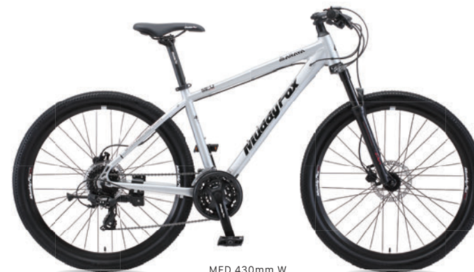
MFD 430mm W (マットサテン)