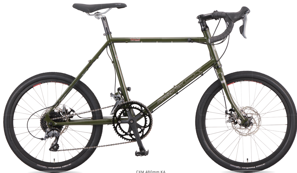
CXM 480mm KA (ミスルトーカーキ)