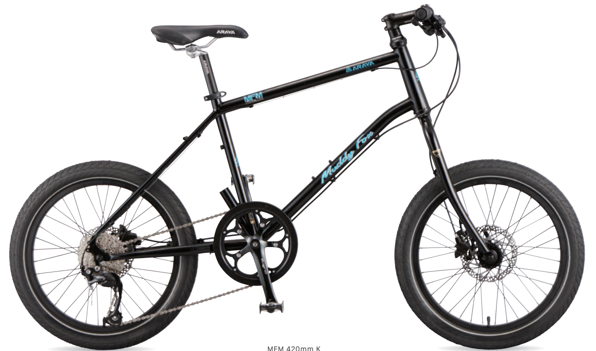
MFM 420mm K (グロスブラック)