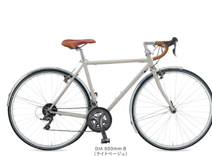
DIA 500mm B (ライトベージュ)

長距離を速く、そして快適に走るためにスポーツ車を見つめなおしました。高速ツーリングに適した700Cホイールには、一般的なロードバイクより少し太めのタイヤを履き、変速、駆動、制動系部品はSHIMANOロードバイク系コンポーネントで統一。デュアルコントロールレバーによりツーリング時の高速巡航を快適にし、前後のフェンダーや輪行ツーリングに便利なカートリッジ式のヘッドセットも標準装備しています。スポーツ車の定番700Cホイールにも、ARAYAの独創を提案いたします。