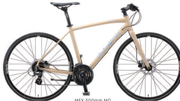
MFX 500mm MO (マットモカ)