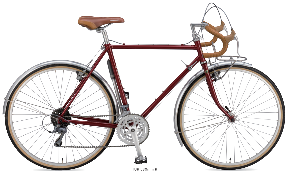
TUR 530mm R (ボルドーレッド)