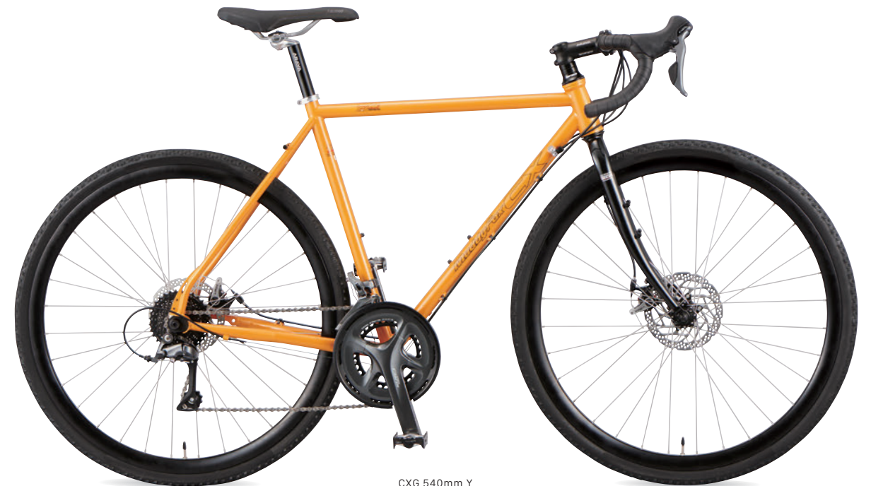
CXG 540mm Y (サンライトイエロー)