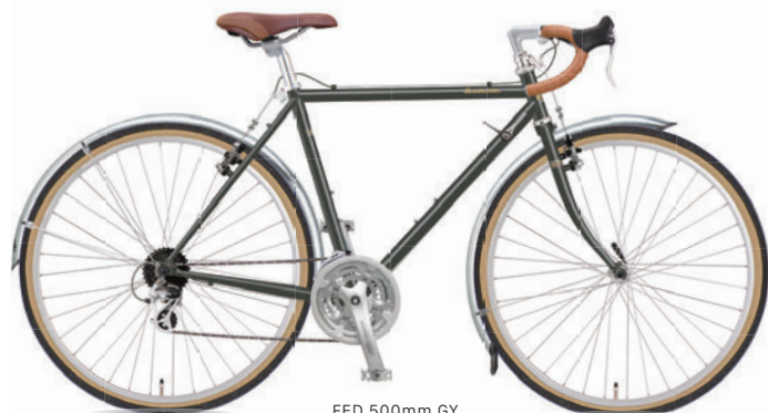
FED 500mm GY (スチールグレー)