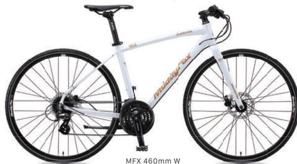
MFX 460mm W (パールホワイト)