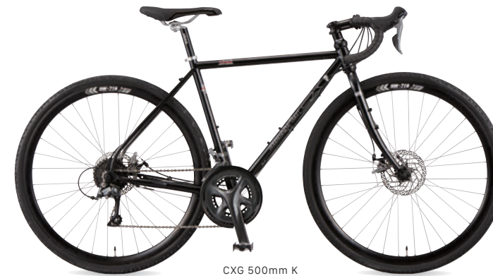
CXG 500mm K (バーンブラック)

気軽に街中から砂利道まで快走するグラベル通勤ター、CXGはさらに速くへも視野を広げるグラベルツーリングへ特化したモデルです。天候や路面のコンディションに性能を左右されにくいディスクブレーキを装備し、フレーム設計には、選択肢の広いフラットマウントのディスクブレーキ台座、SHIMANO E-Thruアクスルへ交換可能なドロップアウト、テーパーコラムに対応できるφ44のヘッドチューブを採用。加えて、ワイドタイヤを装着出来る懐の深さと、多用途に使えるボトル台座をダウンチューブ裏、フォークブレードにまで備えています。