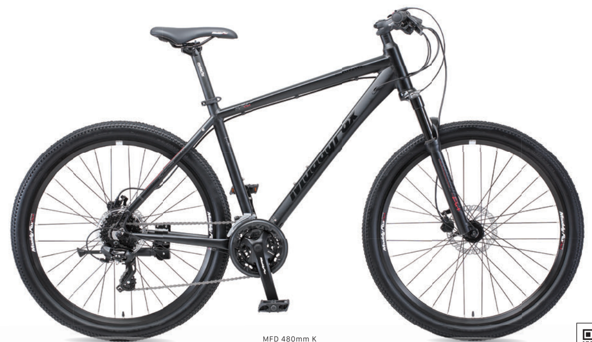
MFD 480mm K (マットブラック)