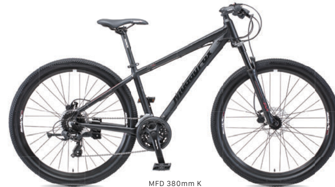
MFD 380mm K (マットブラック)