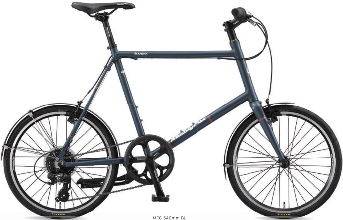
MFC 540mm BL (スモークブルー)