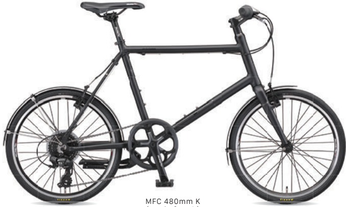
MFC 480mm K (マットブラック)