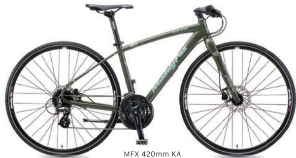
MFX 420mm KA (マットカーキ)