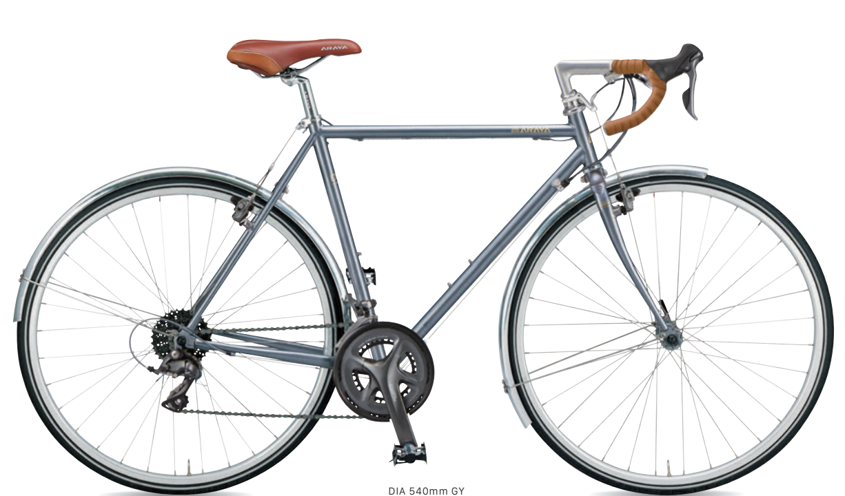
DIA 540mm GY (ダークグレー)