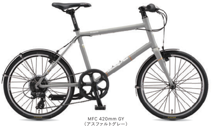
MFC 420mm GY (アスファルトグレー)