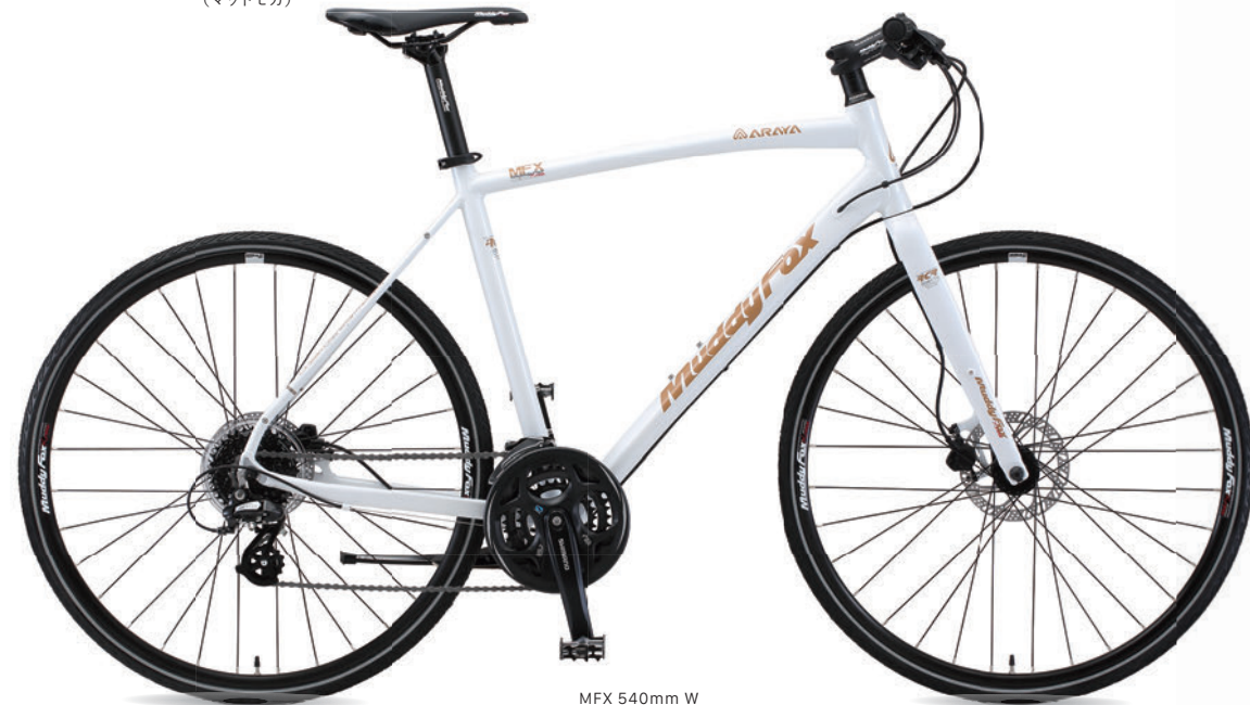
MFX 540mm W (パールホワイト)