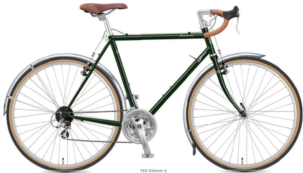
FED 550mm G (ダークモスグリーン)