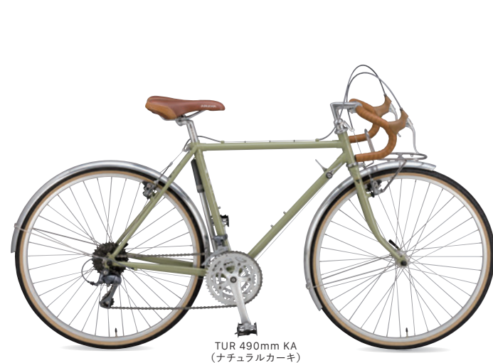
TUR 490mm KA (ナチュラルカーキ)

アラヤ・フェデラルで提案した日本におけるホイールのゴールデンサイズであるハチサン26×1-3/8。欧州ホイール規格のETRTOでは590に相当し、スポーツバイクの標準ホイールサイズの26サイズ559と700Cサイズ622のちょうど中間になります。ハチサンは、昨今主流になるMTBの27.5にも通ずるところもあり、オールラウンドな走行性を有したサイズとも言えましょう。フレームポンプ用のペグやアルミ製フェンダーの採用などの仕様も盛り込みました。長年のARAYAのツーリング志向もバックグラウンドに、ミドルレンジのツーリング車を提案いたします。